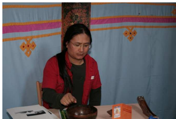
Il dr. Nida mentre fa vibrare una campana tibetana

Cogliamo l'occasione per ricordare di iscriverci per il 2010 alla IATTM-Italia. Il costo è di 35 euro.