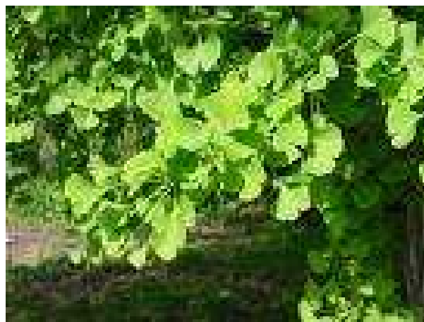
Le foglie di Ginkgo biloba L.

Gli estratti di Ginkgo biloba sono molto utilizzati nella prevenzione e cura di disturbi cerebrovascolari, nei disturbi cognitivi di lieve e media gravità, ansia generalizzata, prevenzione dell'asma bronchiale, demenza senile, tromboflebiti superficiali.